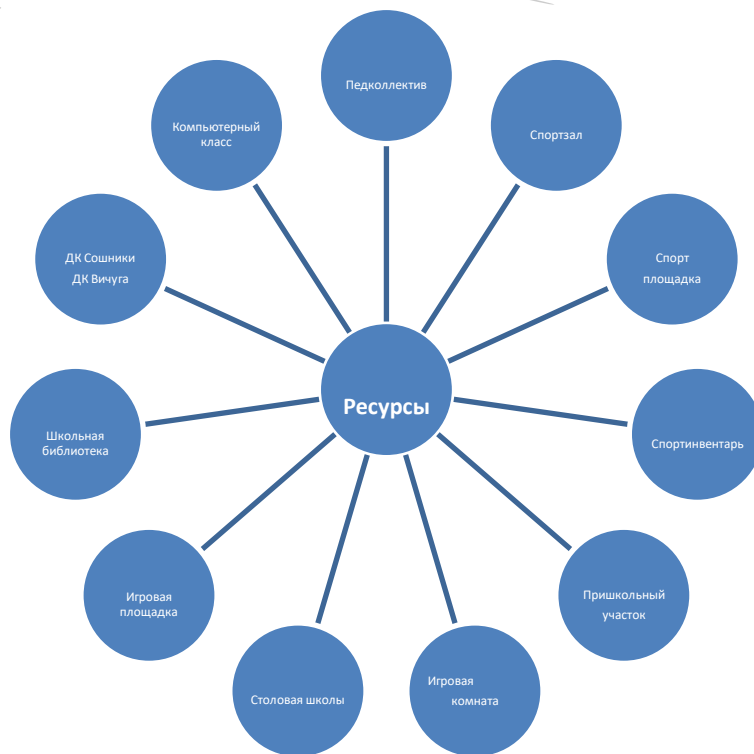
Схема управления программой

Участниками данной программы являются дети в возрасте от 6 до 14 лет различных социальных групп (дети из благополучных семей, дети, оказавшиеся в трудной жизненной ситуации, дети, состоящие на профилактическом учёте). Для организации работы по реализации программы смены: